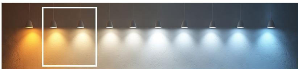
Рисунок 15. Цветовая температура светодиодных ламп

Рекомендуемым к обеспечению для всех групп ВРИ является функциональное и архитектурное освещение. Оно включает в себя освещение входных групп, эвакуационных выходов, вывесок, указателей и т.д. Подсветка осуществляется белым с цветовой температурой (Тц) в диапазоне 2000- 2700 К (рис.15).